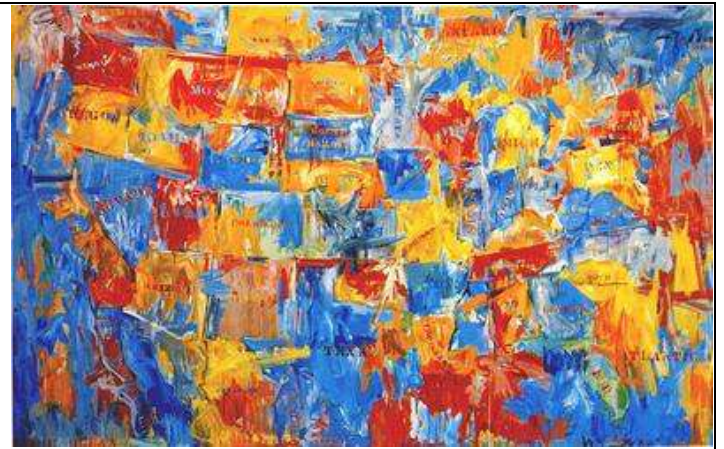
Jasper Johns, Carte , 1961