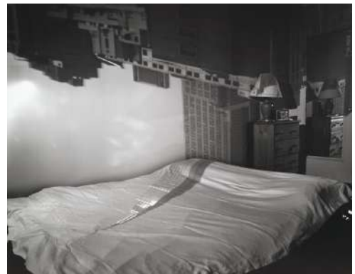
Abelardo Morell, Image de l'Empire State Building dans la chambre , NY, Camera Obscura, 1994