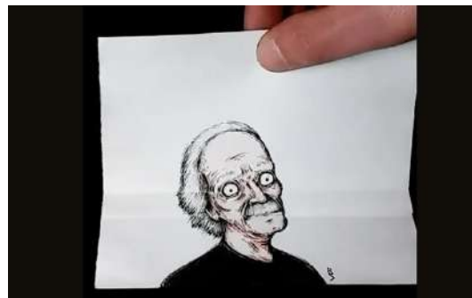
Les monstrueux petits papiers de Ben Avlis http://golem13.fr/les-animations-de-papier-de-ben-avlis/