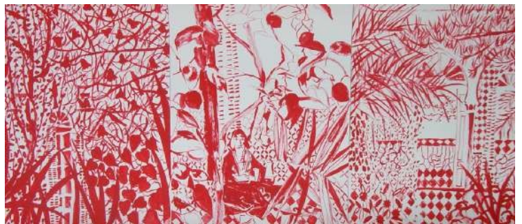
Jean Diego, Dessin Rouge , 2012