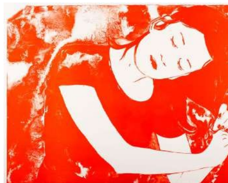
Françoise Pétrouitch, Se coiffer , 2016 lithographie, 120 x 160 cm