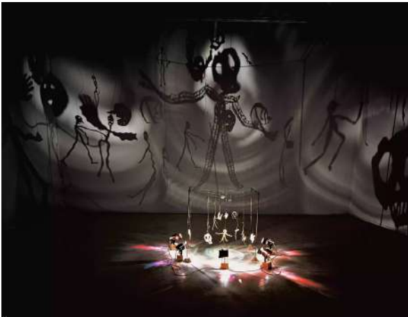
Christian BOLTANSKI , Théâtre d'ombres , 1984. Installation https://www.youtube.com/watch?v=9KDM0B5zcE4