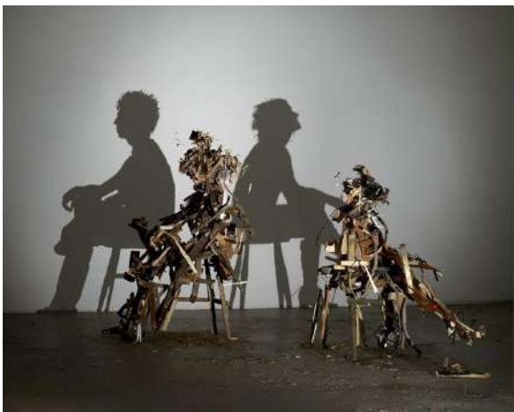
Tim Noble & Sue Webster , sauvages d'humeur sauvage , 2009-2010 Deux escabeaux en bois, bois, projecteur.